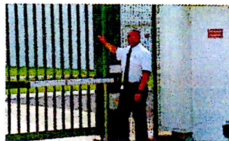
Agent de surveillance sur un site "industrie".

C'est avec l'objectif de professionnaliser et de promouvoir la filière des métiers de la sécurité que l'ADMS a été créée en 1999. L'association rassemble une centaine d'entreprises, principalement des PME. "Nos adhérents interviennent aussi bien dans la composante électronique de la filière, avec les installateurs d'alarmes et de systèmes de télésurveillance, que dans sa composante humaine représen-